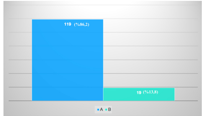
Şekil 3. Stanford sınıflamasına göre olguların (n, %) dağılımı

Histopatolojik bulgulara bakıldığında olguların %28,2'sinde (n=39) ateroskleroz, %21,7'sinde (n=30) elastik dejenerasyon, %10,8'inde (n=15) kistik medyal nekroz mevcuttu. %55,8'inde (n=77) damar duvarındaki patolojik değişiklik belirtilmemişti. Akciğer bulgularına bakıldığında %34,8'inde (n=48) yaygın intraalveoler kanama, %6,5'inde (n=9) fokal intraalveoler